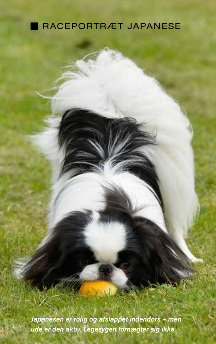
Japanesen er rolig og afslappet indendørs – men ude er den aktiv. Legesygen fornægter sig ikke.